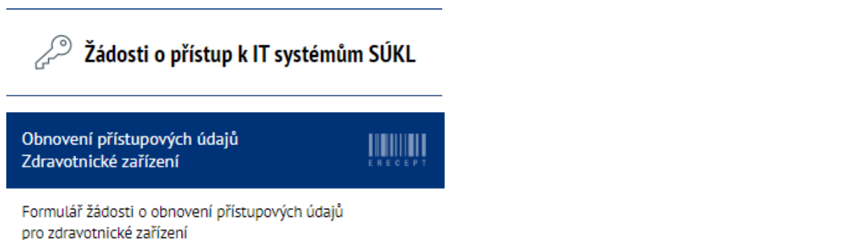
(Obrázek č. 1)

Na webových stránkách https://pristupy.sukl.cz v sekci: „Žádosti o přístup k IT systémům SÚKL“ zvolte dlaždici „Obnovení přístupových údajů Zdravotnické zařízení“ a klikněte na ni. (Viz obrázek č. 1)